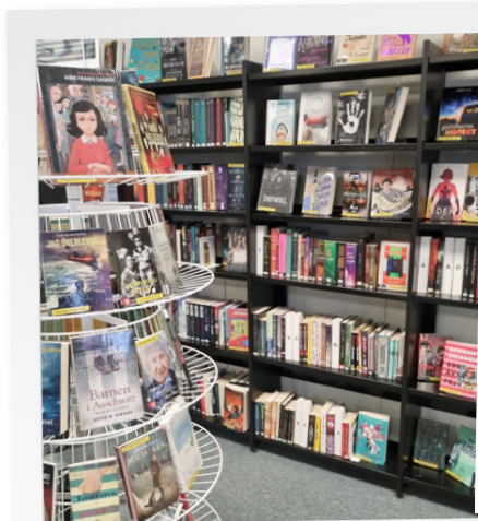
Biblioteket är skolans hjärta och navet i arbetet med läsning på skolan.